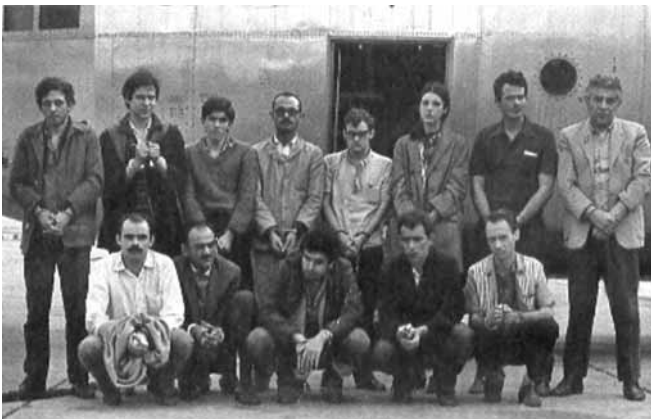
(Roberto Catelli Junior, História – texto e contexto .)

10. Presos políticos trocados pelo embaixador norte-americano seqüestrado no Brasil em setembro de 1969.