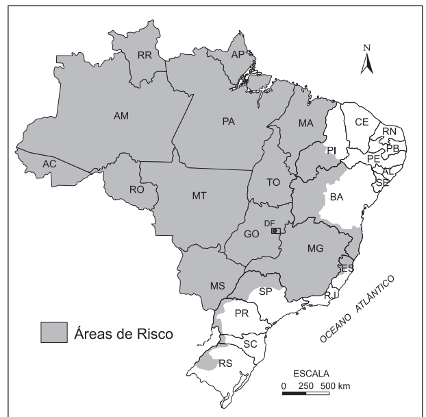
ÁREAS DE RISCO DA FEBRE AMARELA NO BRASIL

(Ministério da Saúde – SVS. Acessado em 14.02.2008.)